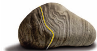
DAS BESTE AUS STEIN

Ich bin bestrebt, Sie individuell zu beraten und zusammen mit Ihnen im Gespräch ein persönliches Grabmal zu entwerfen.